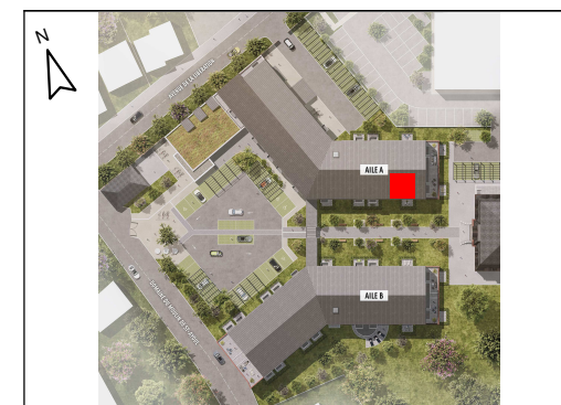
T2 - N° A0.06